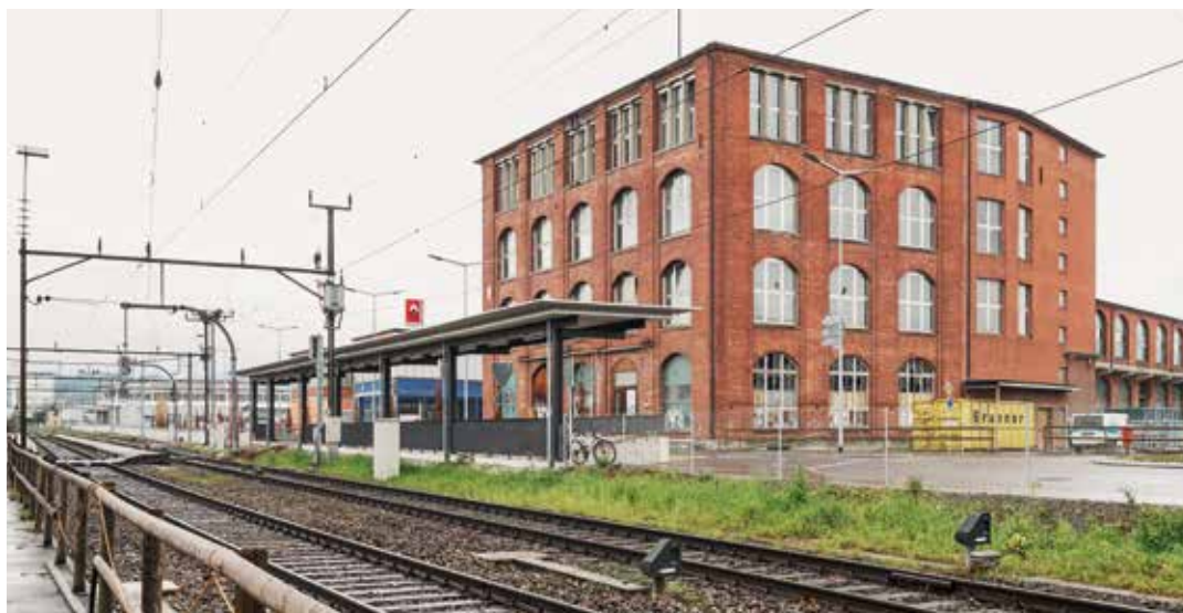
Der Hamel vor der Renovation: Der Anschluss der SBB-Unterführung war eine technische Herausforderung.

Die 1980er-Jahre brachten das zeitweilige Aus. 1982 stellte Saurer das Lastwagen-Geschäft und 1986 auch noch die Produktion von Webmaschinen ein. Damit war das Schicksal des Hamel-Gebäudes fürs Erste beschieden – aber nur fürs Erste: 2012 kaufte HRS das Saurer WerkZwei für 35 Millionen Franken von der OC Oerlikon. Zuvor hatte das Immobilienunternehmen bereits das Hotel Metropol erworben. Und 2013 kam das Hamel-Gebäude hinzu. Gemeinsam mit einem Architekturgremium, den Behörden und Denkmalschützern wurde nach und nach ein Plan entwickelt: Das Saurer WerkZwei sollte zu einem neuen Arboner Stadtteil werden. Das Hamel-Gebäude bildet sozusagen das Tor dazu und sollte für weitere 35 Millionen Franken renoviert werden.