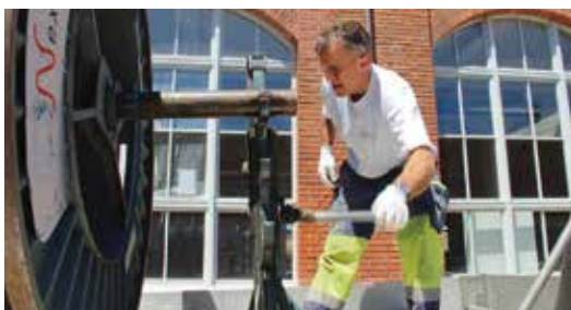
Ein Kabelzug beim Hamel-Gebäude.

Ein grosses Gelände wie das Saurer WerkZwei benötigt einen zuverlässigen Partner, wenn es um Energie, Wasser und Kommunikation geht. Die Arbon Energie AG bietet dies mit ihrer über hundert jährigen Erfahrung – für die ganze Bevölkerung und alle Unternehmen in Arbon.