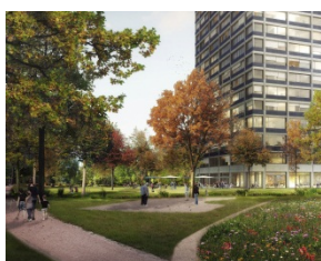
Hochhaus Saurer Areal Aussen 2* (© Gmür & Geschwentner Architekten AG)