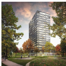
Hochhaus Saurer Areal Aussen 1* (© Gmür & Geschwentner Architekten AG)